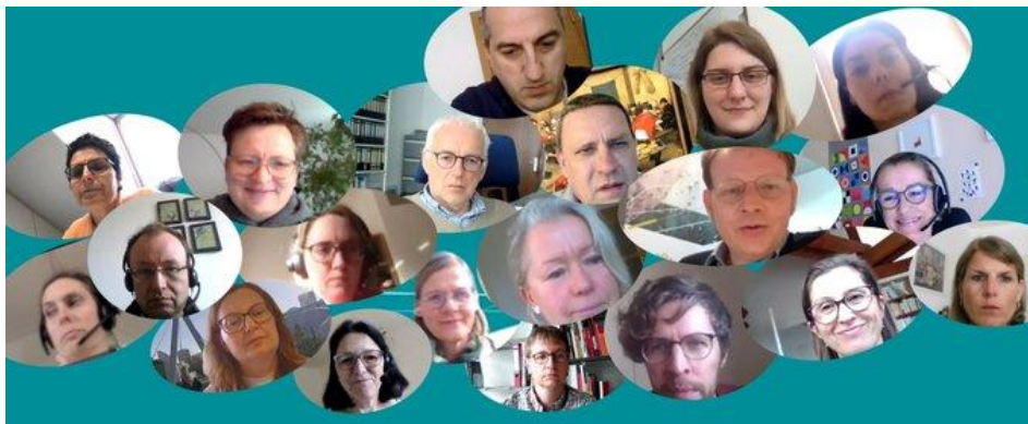
Strategic Workshop | UniGR-CBS Steering Committee

Schon bei der Antragstellung für das laufende Interreg VA GR-Projekt (2018-2022) wurden Maßnahmen geplant, um die Zukunft des UniGR-CBS vorzubereiten. Aktuell zählen dazu die Sicherung der Projektergebnisse und die Nachhaltigkeit der UniGR-CBS-Kooperation nach Projektende im Juni 2022. Dafür hat das UniGR-CBS in 2019 die Taskforce „Mission ZukunftAvenir UniGR-CBS“ eingerichtet, der Vertreter*innen des UniGR-CBS-Lenkungsausschusses angehören mit dem Auftrag, für die Verstetigung des UniGR-CBS eine strategische Vision mit operativem Aktionsplan auszuarbeiten. Das Konzept verbindet die erfolgreich aufgebauten Ressourcen und erprobten Kooperationsroutinen mit ambitionierten Entwicklungszielen, die mit Hilfe der UniGR-CBS-Partneruniversitäten und Drittmitteln erreicht werden sollen. Auf Initiative der Taskforce entwickeln derzeit Arbeitsgruppen des UniGR-CBS-Lenkungsausschusses noch zu integrierende Zukunftsprojekte in den Bereichen Forschung, Science-Policy-Interface und Promovierendenausbildung . Das Verstetigungskonzept, das das UniGR-CBS in ein dauerhaftes interregionales und interdisziplinäres Kompetenzzentrum der UniGR überführt, wird den Präsidenten und Rektoren der UniGR-Universitäten im Herbst 2021 vorgelegt.